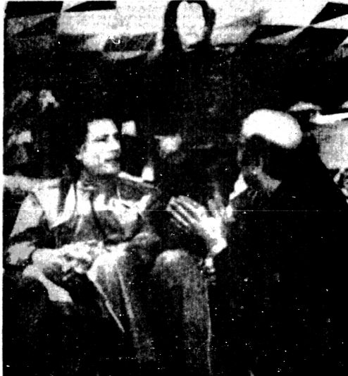
Khadafy acepta rezos por su éxito en la Universidad Al Fatah de Trípoli.